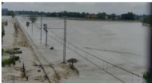
La linea presso Bagnacavallo (RA)

Ulteriore beffa dopo il danno è che in questo paese dove i disastri di origine alluvionale sono annuali quando non mensili, non esistono esercitazioni, piani di evacuazione,